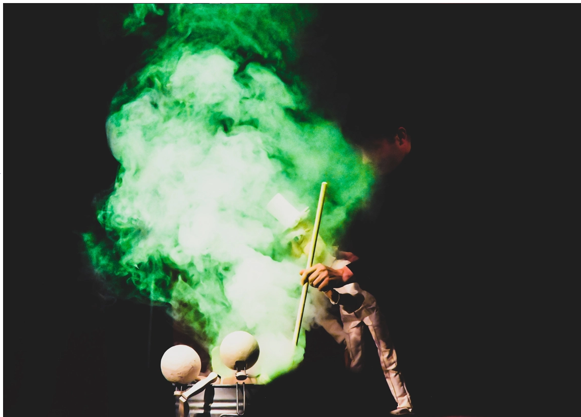
Stari in drzni, fotografija: Katarina Zalar

Stari in drzni so skupina upokojencev, ki zadnja leta svojega življenja preživljajo v domu, poimenovanem Lutkalica. Za popestritev pripravijo predstavo v obliki varietéja, v katerem nas vsaka